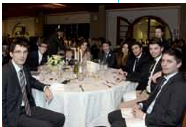
Il gruppo dei giovani del Rotaract di Lignano Sabbiadoro-Tagliamento.