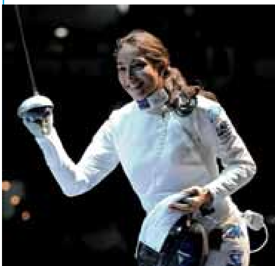
Foto sotto: due significative immagini della campionessa friulana.