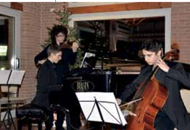
Sopra: il trio che ha allietato la serata.