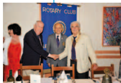
Stretta di mano fra il PDG Nerio Benelli e il presidente Luigi Tomat, al centro il Governatore Bruno Maraschin

È evidente, continua il Governatore, che identità ed appartenenza costituiscono l'essenza della compagine sociale e sono fondamentali per le azioni, per la progettualità e per l'immagine che i Rotariani danno di se stessi nell'ambiente in cui vivono. Concludendo, il messaggio che il Governatore ci lascia, che è anche un punto di partenza, è "essere fieri e orgogliosi di appartenere al Rotary e dimostrarlo in ogni occasione" .