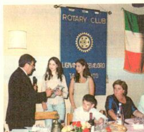
Le ragazze dello "SCAMBIO GIOVANI"