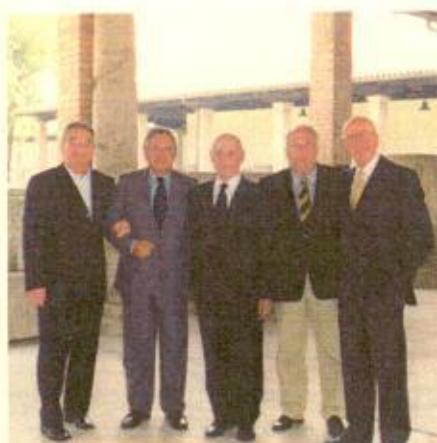
I Fautori del progetto "TARGHETTE DI AQUILEIA"