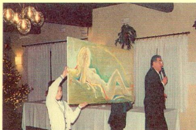
ALL'ASTA IL DIPINTO DI FAVOTTO: BATTITORE RENATO TAMAGNINI